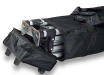
Estuche para Carpa