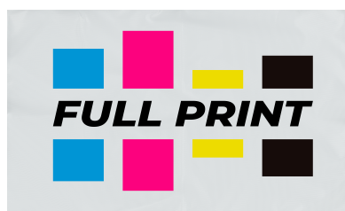
Tela de Impermeable de 250 g/m 2