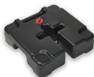
Base de Carpa